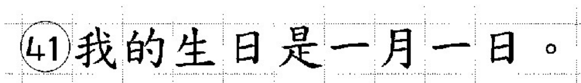
Рис. 24. Образец написания иероглифических знаков

Бланк ответов № 2 (лист 1 и лист 2) по китайскому языку (рис. 22, 23) предназначен для записи ответов на задания с развернутым ответом по китайскому языку (строго в соответствии с требованиями инструкции к КИМ ЕГЭ и к отдельным заданиям КИМ ЕГЭ). Каждый иероглифический знак и каждый знак препинания следует писать внутри отдельной клетки в поле ответов бланка ответов № 2 (ДБО № 2) (рис. 24).